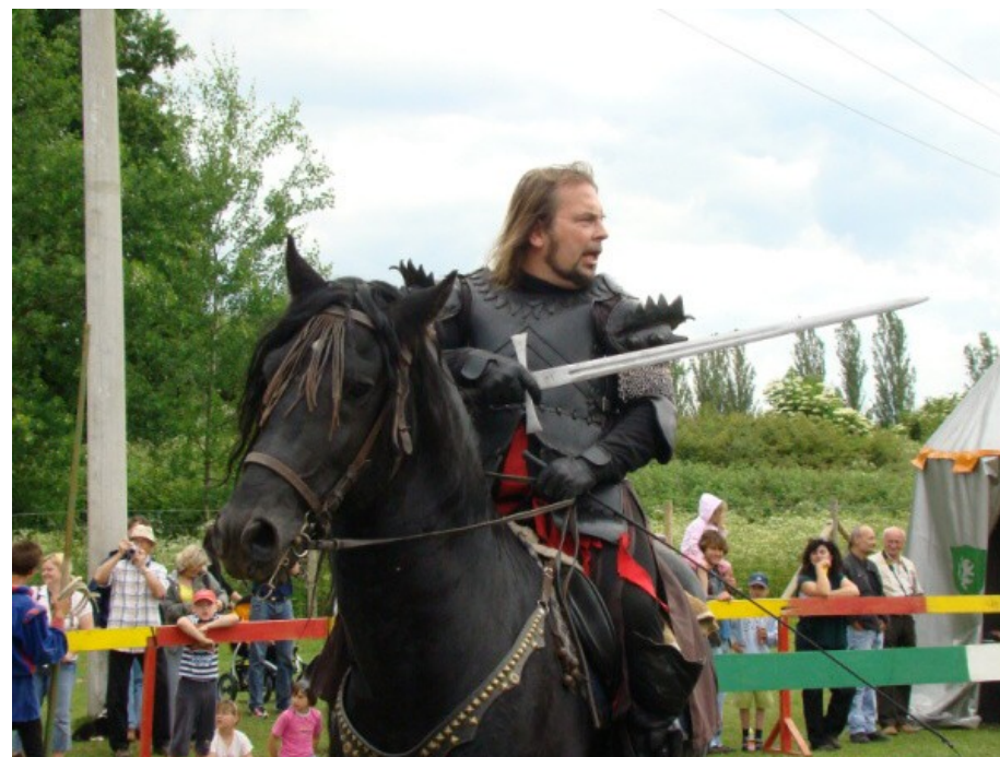
rytíři byli úžasní

V sobotu 21. června jsem jel s rodiči a také se stacionářem na pěknou akci do Stanovic. Přijeli jsme trochu později a už jsem nestihl pravou svatbu na koních. Viděl jsem drezuru na koni, moc se mi to líbilo. Pak nás čekala podívaná na rytířský turnaj, byla to skupina Trakeni. Byly souboje s dřevcem, mečem, hod na lidskou hlavu, střelba z luku na divoké prase. Rytířský souboj byl zajímavý a asi to tak dříve i bývalo. Mezi rytíře se k souboji přihlásila i princezna a já jsem jí držel palce. Šlo jí to opravdu dobře. Prožil jsme ve Stanovicích pěkné odpoledne. ●